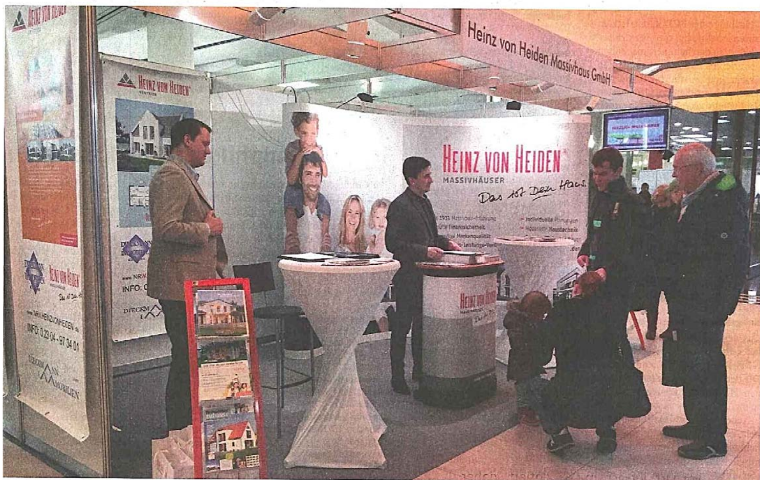
An den Ständen der Aussteller können sich die Besucher der Bautage informieren und von den Experten beraten lassen.

2. Mülheimer Bautage vom 25.-26. März in der Stadthalle